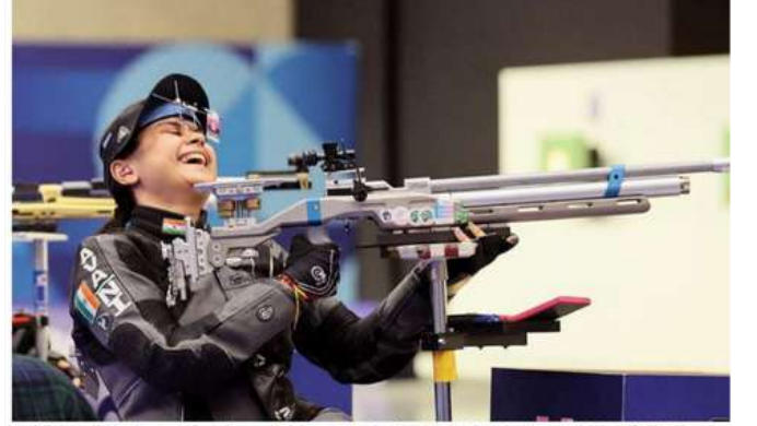
Crack shot: Avani Lekhara became the first Indian woman to win two Paralympic gold medals when she retained the women's 10m air rifle title, with a new record in Paris on Friday.