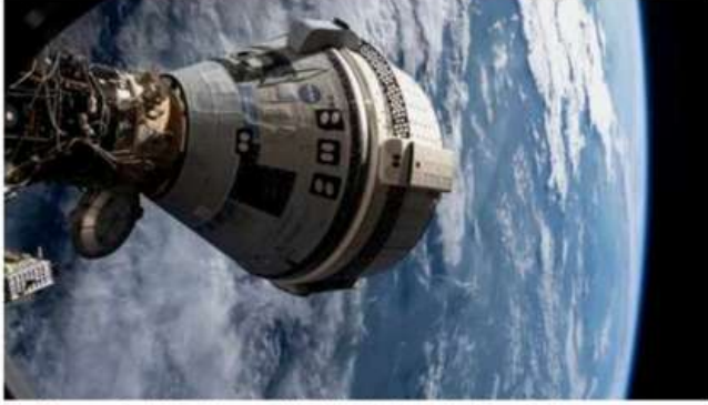
Stuck in space: Boeing's Starliner capsule docked at the International Space Station.

दोनों अंतरिक्ष यात्री फ़रवरी में स्पेसएक्स ओरियन कैप्सूल से धरती पर वापस लौटेंगे।