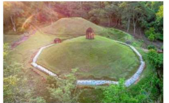
An aerial view of the royal burial mounds built by the Ahom dynasty in Charaideo in eastern Assam.

पिरामिडों की तरह, मोडेम अहोम राजघराने के सदस्यों की मिट्टी की कब्रगाह हैं, जिनके 600 साल के शासन को ब्रिटिश राजघराने ने खत्म कर दिया था। अब तक खोजे गए 386 मोडेमों में से चैर देव में 90 सबसे अच्छी तरह संरक्षित हैं। यह चराईदेव जिले को पर्यटन स्थल बनाता है।