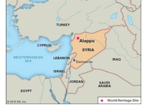
ence in Syria since Israel started its military operations in Gaza.