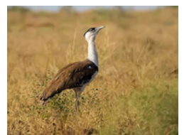
ग्रेट इंडियन बुस्टर्ड