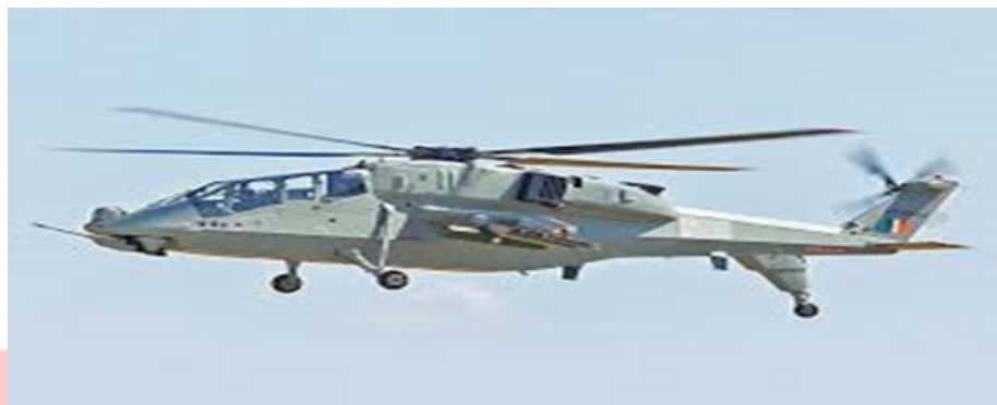
एलसीए तेजस एंड और प्रचंड