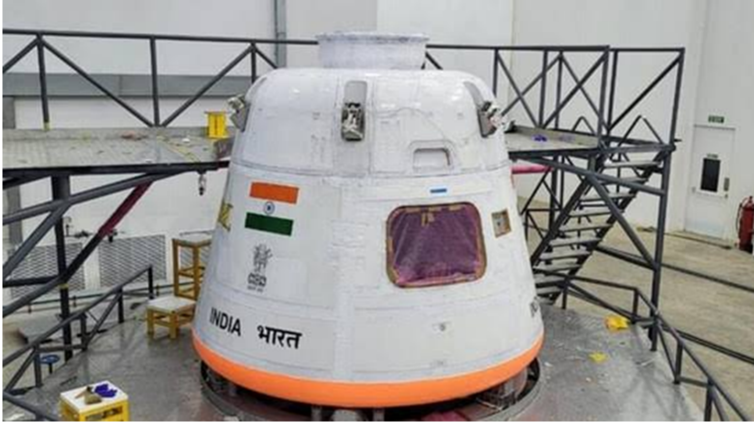
Maiden test flight of Gaganyaan mission