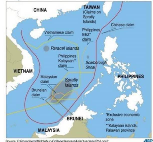
Disputed claims in the South China Sea

चीन के तट रक्षक ने विवादित स्कारबोरो तट से फिलीपींस के एक जहाज का पीछा करने का दावा किया है। बीजिंग ने कहा कि फिलीपींस का जहाज स्कारबोरो तट के बगल से पानी में चला गया था और उसने वापस लौटने के लिए कई कॉलों को नजरअंदाज कर दिया।