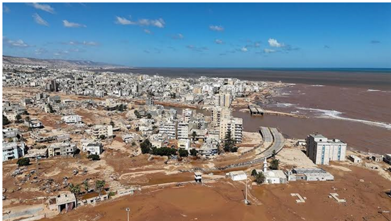
डरना सहर बढ़के बाद

पूर्व आईएस राजनयिक को नैतिकता उल्लंघन के लिए परीक्षा मिलती है