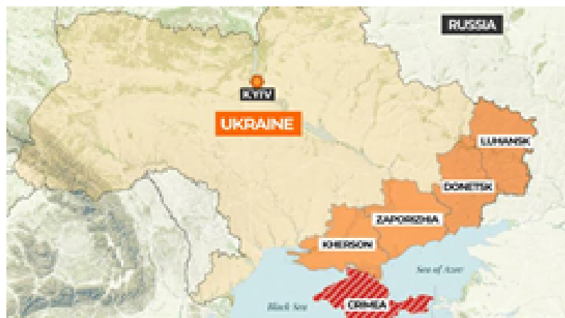
उरोजैन डोनेस्क के सीमा पीआर है

कीव ने बुधवार को कहा कि उसकी सेना ने यूक्रेन में दक्षिणी मोर्चे पर रूसी सेना को मात देने के लिए औद्योगिक डोनेट्स्क क्षेत्र में उरोजाइन बस्ती को मुक्त करा लिया है।