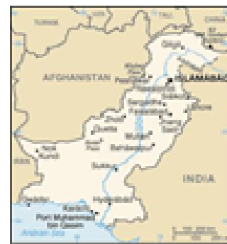
पाकिस्तान का फैसलाबाद सहर

पाकिस्तान में ईशनिंदा एक गंभीर अपराध है और इसके लिए मौत की सजा तक हो सकती है।