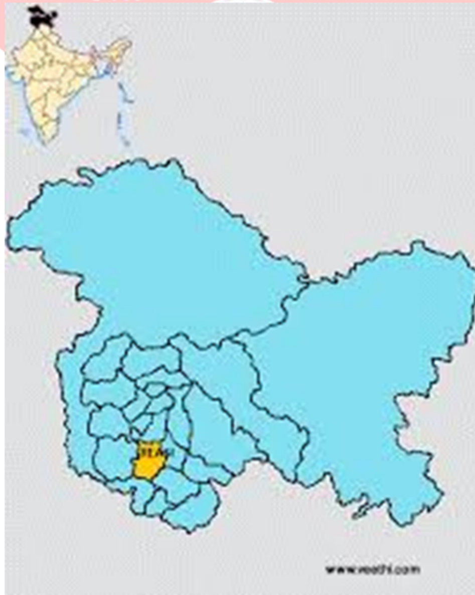
जम्मू और कश्मीर का रईसी जिला में पिछले साल एक भूत बड़ी लिथियम का रिजर्व मिला

अन्य खनिज जो सरकार ने खनन के लिए खोले हैं वे हैं बेरिल, नाइओबियम, टाइटेनियम और ज़िरकोनियम। पहले इन्हें केवल राज्य स्वामित्व वाली कंपनियों द्वारा ही खनन करने की अनुमति थी। सरकारी बयान में कहा गया है कि निजी कंपनियों की भागीदारी "फोर्स मल्टीप्लायर" होगी।